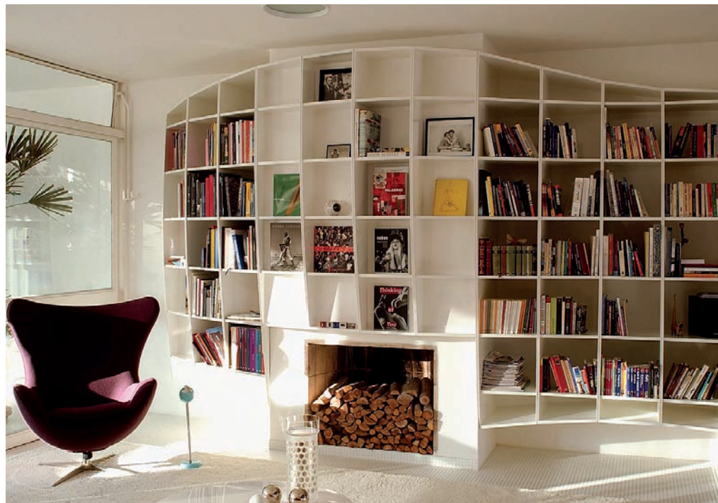
Das wellenförmige Regal besteht aus unterschiedlichen, frei kombinierbaren Modulen