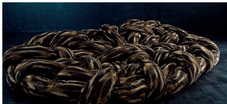
Das Sofa „Boa“ mit Polsterung aus dem Jahr 2006 der Brüder Campana für Edra