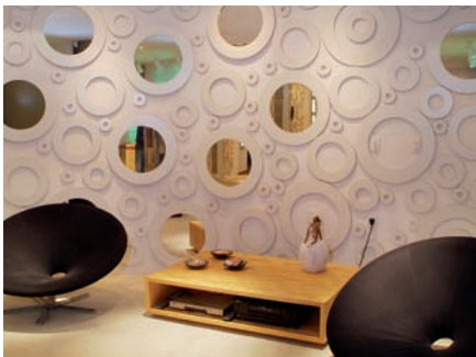
„Redonda“-Stühle von Lattoog Design