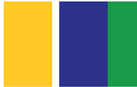
Die vier Designer von „Colletivo“ arbeiten in den Bereichen Illustration, Grafik, Webdesign und Film

Farbenfrohe Illustrationen, sozialkritische Collagen, Filme, Internetseiten, der Kreativität sind keine Grenzen gesetzt. Beide Designer veröffentlichten einige ihre Arbeiten auch in dem Buch „Disorder in Progress“, erschienen im Die Gestalten Verlag, herausgegeben von dem Star der brasilianischen Grafikdesign-Szene, Nando Costa. Verschiedene Grafiker wurden aufgerufen, Entwürfe einzureichen zu Dingen, die sie am brasilianischen Alltag frustrierten. Quasi exemplarisch für die Außen- und Innenwelt Brasiliens ist demnach der Umschlag des Buches überaus farbenfroh und fröhlich geraten, die Innenseiten halten sich durchweg in schwarz und weiß.