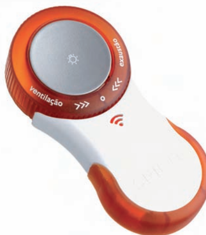
Die Rundfernbedienung für den Ventilator „Spirit“ von Indio da Costa Design

Außen bunt, innen schwarz-weiß: „Disorder on Progress“, herausgegeben von Nando Costa, © Die Gestalten Verlag, 2006 ►