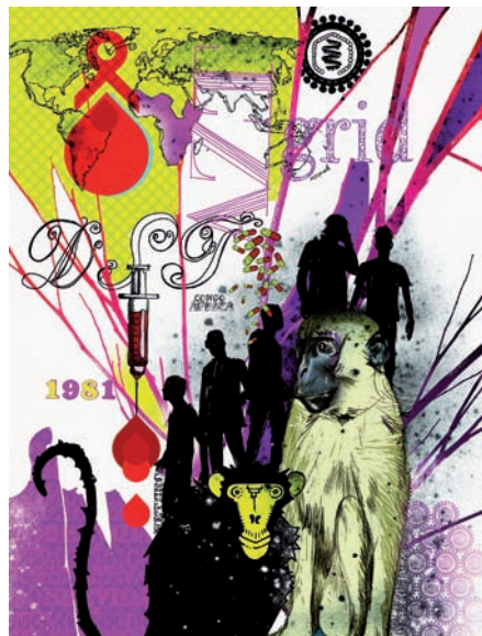
„Construtivista“ des Grafikdesigners Chico Jofilsan