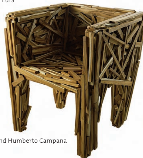
Der „Favela“-Chair von Fernando und Humberto Campana in der Teak Holz-Ausführung

BEI KAUM EINEM ANDEREN LAND GEHEN DIE ASSOZIATIONEN SO WEIT AUSEINANDER WIE BEI BRASILIEN. DIE EINEN DENKEN AN KARNEVAL IN RIO, WEISSE STRÄNDE, FUSSBALL-MAGIER, LEBENSFREUDE UND SCHÖNE MENSCHEN IN KNAPPEN BIKINIS. ANDERE VERBINDEN BRASILIEN IN ERSTER LINIE MIT ARMUT, KORRUPTION, STRASSENKINDERN, KRIMINALITÄT UND DEN FAVELAS, ARMUTSVIERTELN VOR DEN TOREN DER MEGAMETROPOLN. BEIDES IST IM ALLTAG DES GRÖSSTEN LANDES LATEINAMERIKAS REALITÄT. BRASILIEN LEBT DURCH UND TROTZ SEINER WIDERSPRÜCHE.