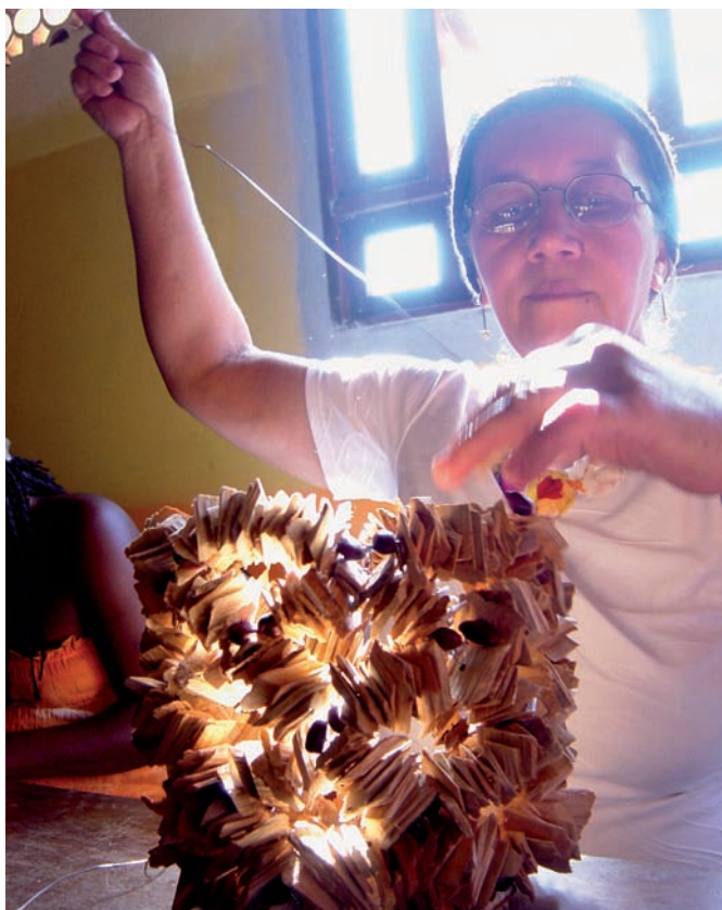
Paula Dibs Produkte verbinden traditionelles Handwerk und modernes Design