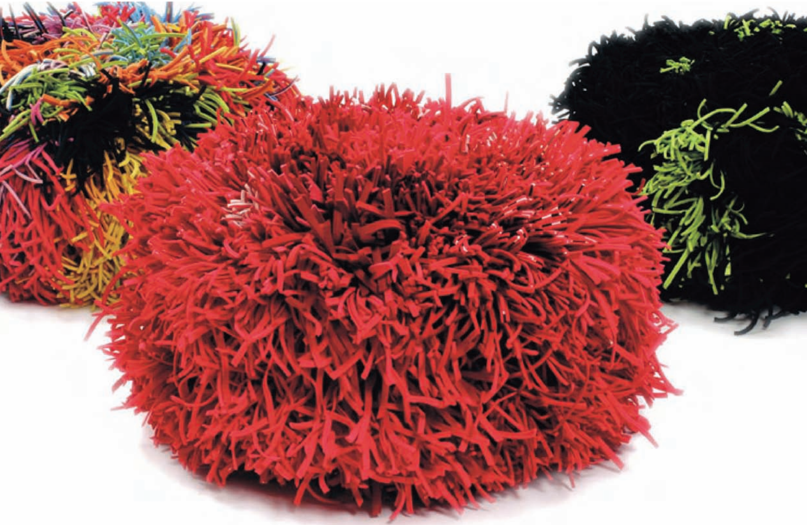
Die Sitzgelegenheit „Miss Gana“ von Gueto besteht aus wiederverwerteten Plastikstreifen